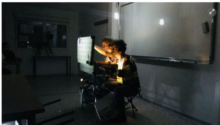
Du théâtre comique pour faire aimer la physique