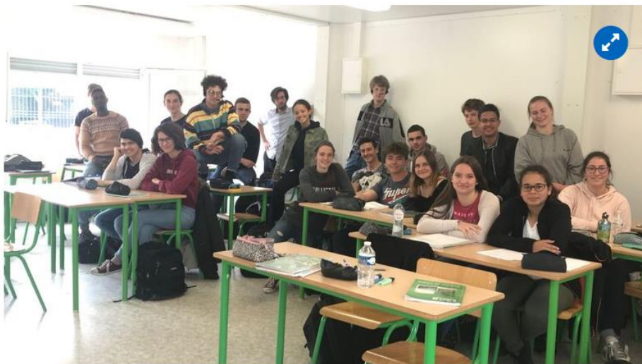
Du théâtre comique pour faire aimer la physique

Ce duo de jeunes comédiens se présente sous le nom « Circonférence ». Ils sont présents sur les réseaux sociaux ( fb.me/CirconferenceSpectacle ).